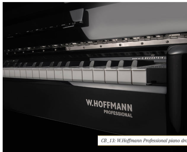
CB_13: W.Hoffmann Professional piano droit