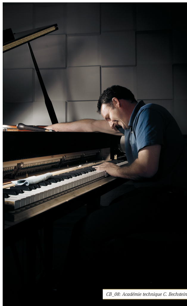
CB_08: Académie technique C. Bechstein 1

www.bechstein.com/fr/service/academie-technique-c-bechstein