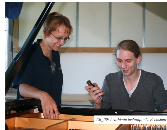
CB_09: Académie technique C. Bechstein 2