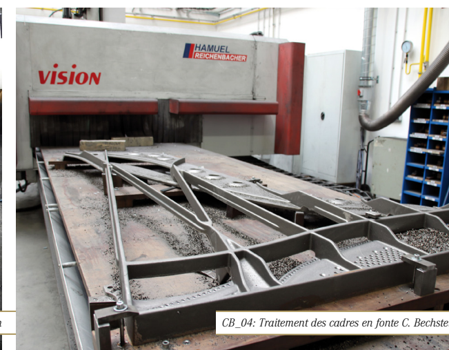
CB_04: Traitement des cadres en fonte C. Bechstein