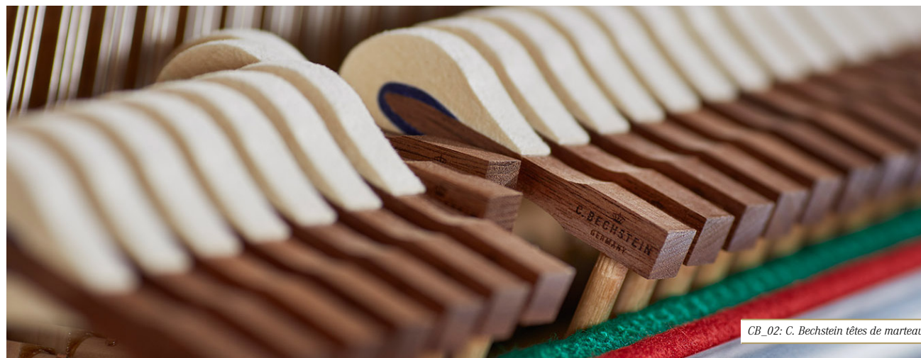
CB_02: C. Bechstein têtes de marteaux

En 2016, le groupe C. Bechstein a maintenu ses parts de marché en Allemagne tout en augmentant sensiblement ses exportations, la tendance se maintenant dans les premiers mois de la nouvelle année. Ce groupe basé à Berlin contrôle près de trente pour cent du marché allemand, ce qui en fait un des principaux fabricants de pianos au niveau européen. Des investissements considérables ont été réalisés en 2016 afin de pérenniser cette situation : 1,1 millions d'euros à la manufacture de Seiffhennersdorf, en Saxe (développement d'une unité de production des têtes de marteaux, rénovation et agrandissement du parc de machines CNC, améliorations technologiques diverses) ; 1,4 millions d'euros sur le site de Hradec Králové, en République tchèque (modification et agrandissement des installations utilisées par C. Bechstein Europe, développement d'un centre d'expertise pour le traitement des surfaces et des cadres en fonte).