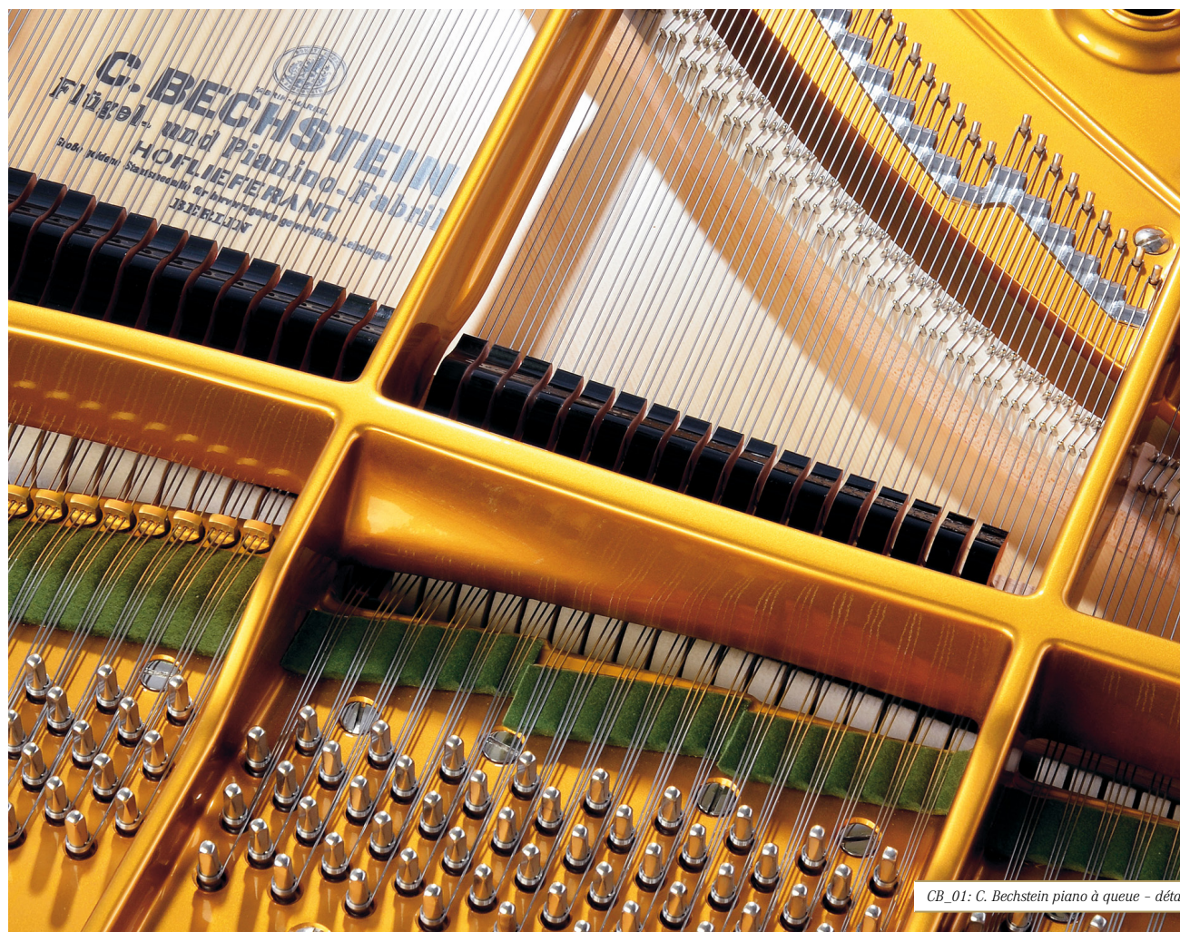
CB_01: C. Bechstein piano à queue - détail

Les ventes de pianos à queue ont par ailleurs augmenté de quinze pour cent par rapport à l'année précédente. En 2016, le groupe a réalisé un chiffre d'affaires de 33 millions d'euros (29 millions en 2015), le taux de rentabilité opérationnelle après impôts s'élevant à 7,5 %.