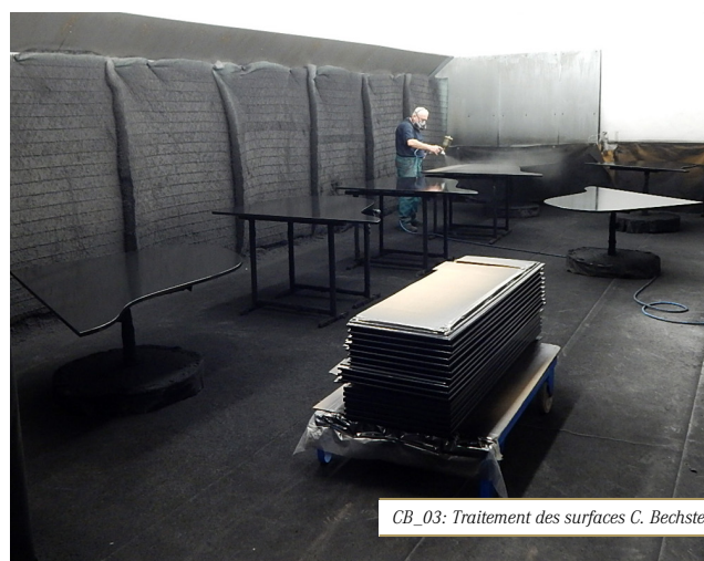
CB_03: Traitement des surfaces C. Bechstein