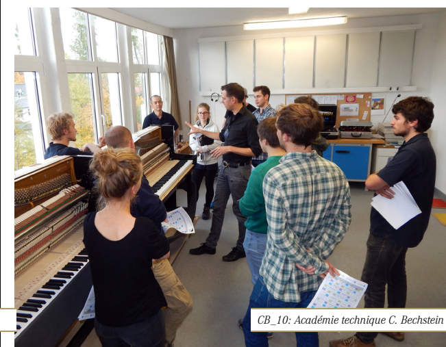
CB_10: Académie technique C. Bechstein 3