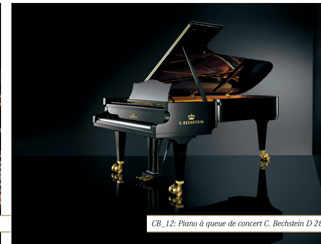
CB_12: Piano à queue de concert C. Bechstein D 282